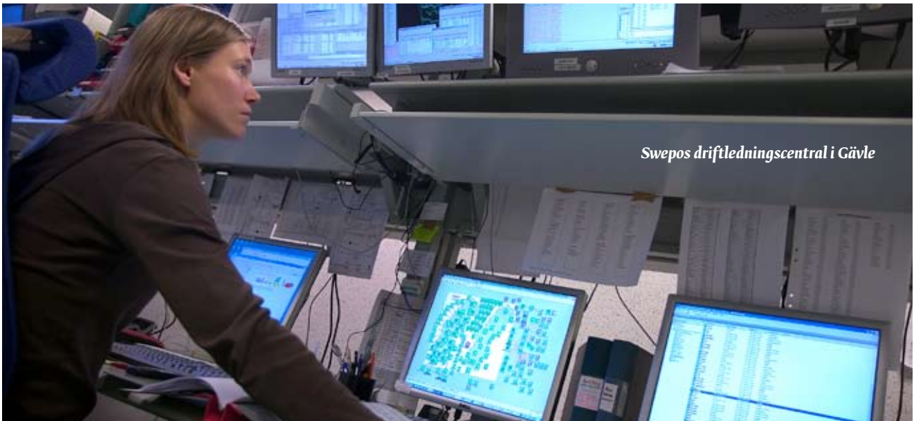
Swepos driftledningscentral i Gävle